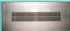
دریچه بازدید فن کوئل فلزی ۹۰ درجه (با فنل ریخته‌سنگ) AIR-FD412