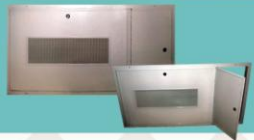
دریچه بازدید فن کوئل آلومینیومی (با فنل ریخته‌سنگ) AIR-FD417