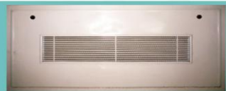
دریچه بازدید فن کوئل مشکلی پشت توری (با فنل ریخته‌سنگ) AIR-FD413